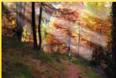
Luce d'autunno (Castelletto Monferrato - Alessandria)