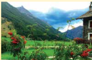
Villa Malvezzi Foto di Sergio Calabrese (Pavia)