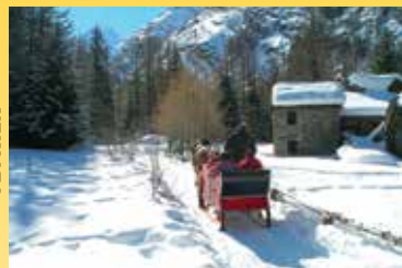
Slitta in Valontey