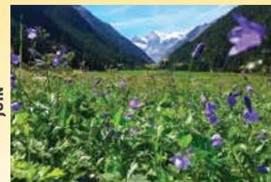
I fiori del Paradiso