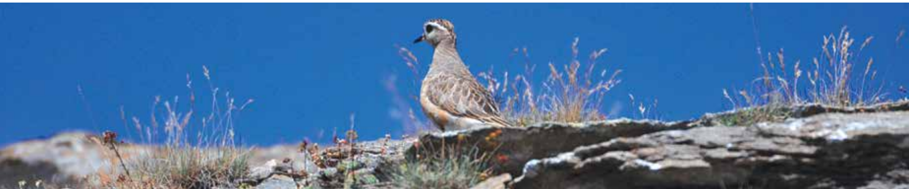
Piviere dorato di passaggio durante la migrazione - tappa al Col du Drinc