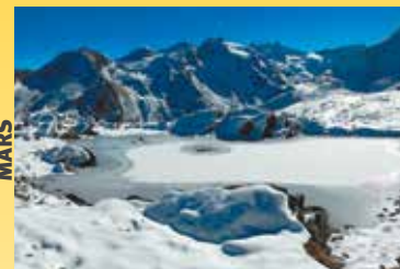
I laghetti del Lauson