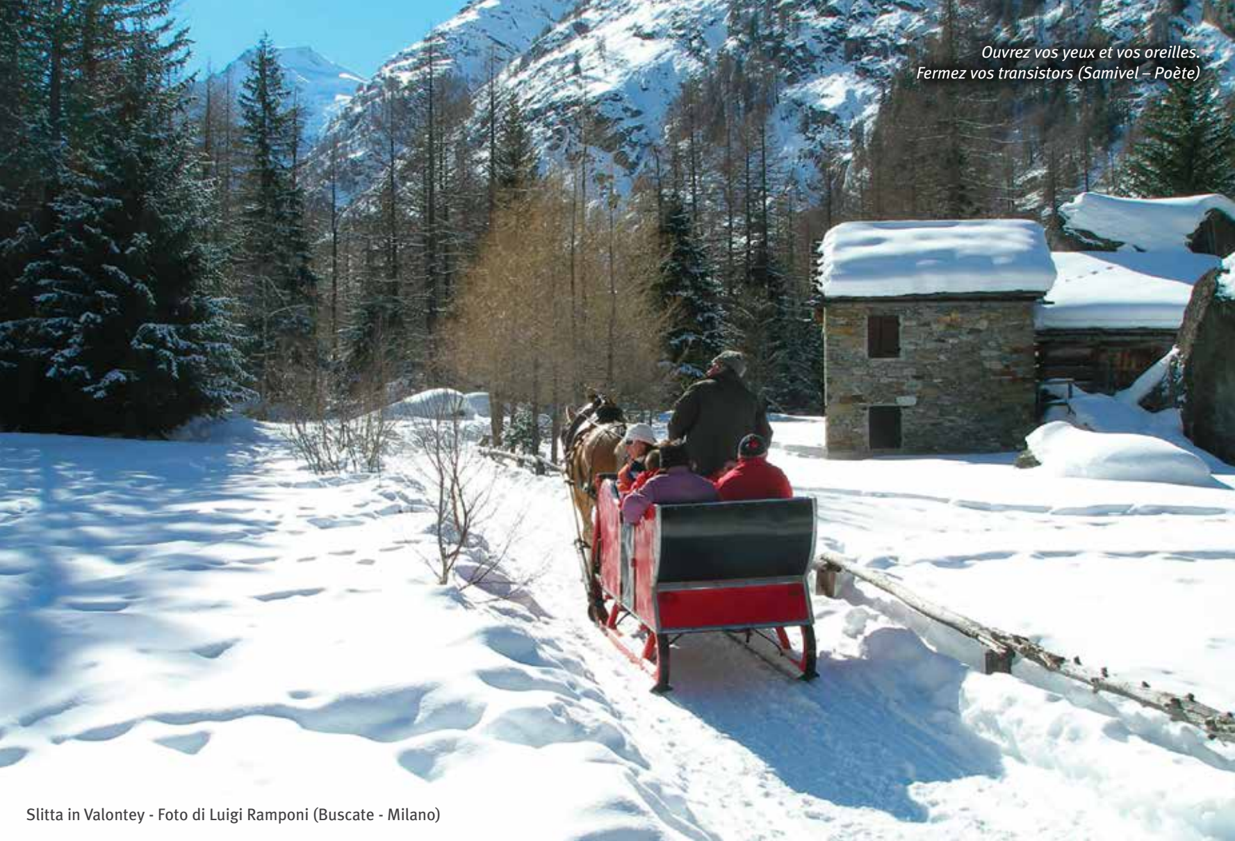
Slitta in Valontey

Ouvrez vos yeux et vos oreilles. Fermez vos transistors (Samivel – Poète)