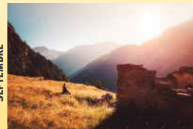
Guardando verso l'autunno