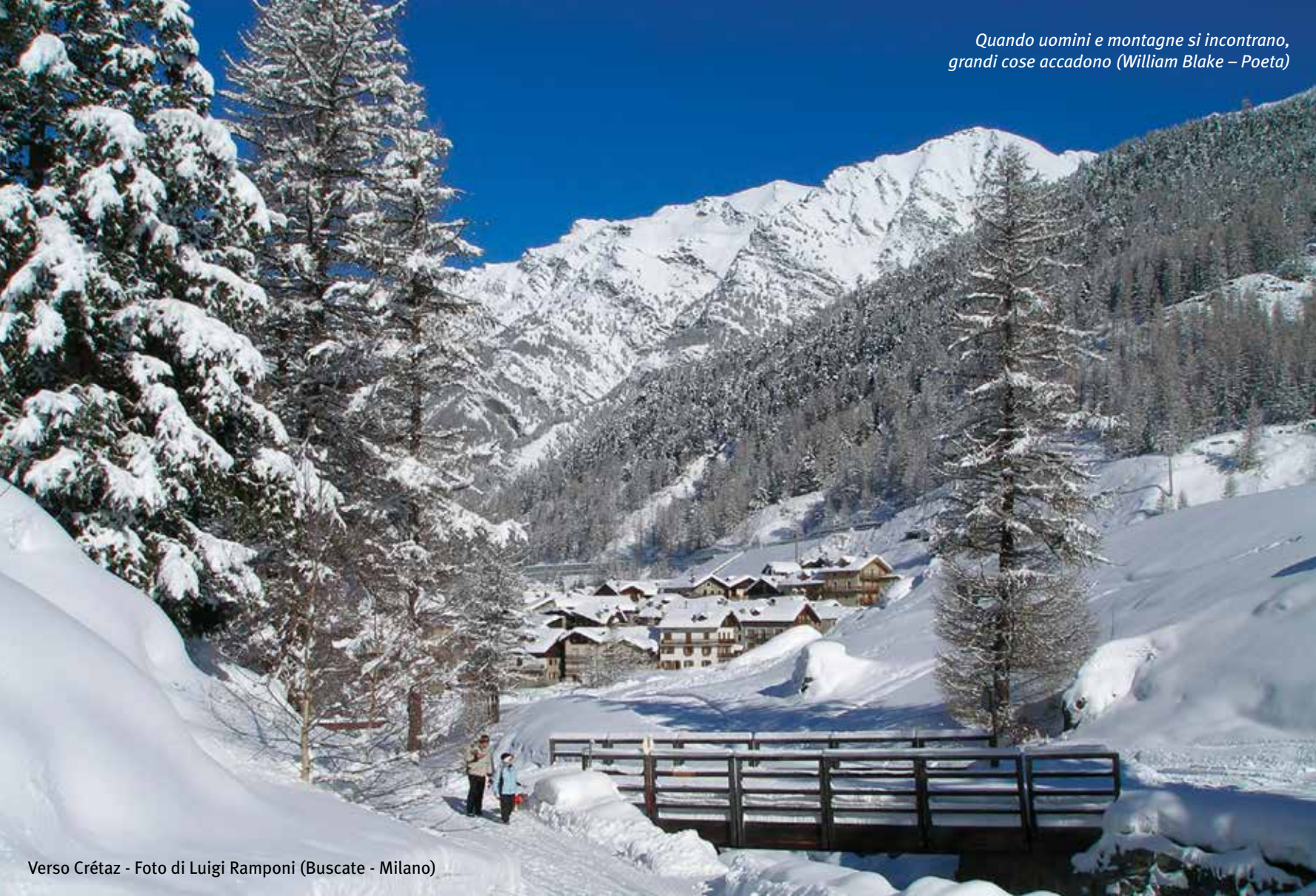
Verso Crétaz

Quando uomini e montagne si incontrano, grandi cose accadono (William Blake – Poeta)