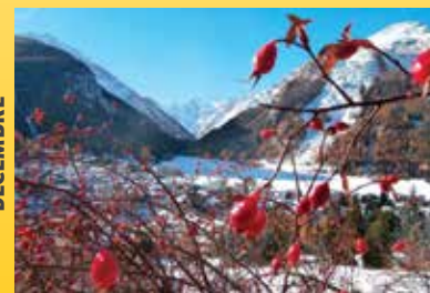
Tepori d'inverno Claudio Perratore (Cogne - Valle d'Aosta)