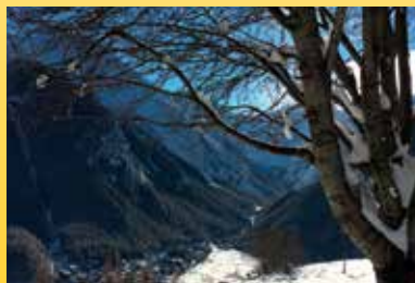
Scorci sul Paradiso Giuseppe Cutano (Cogne - Valle d'Aosta)