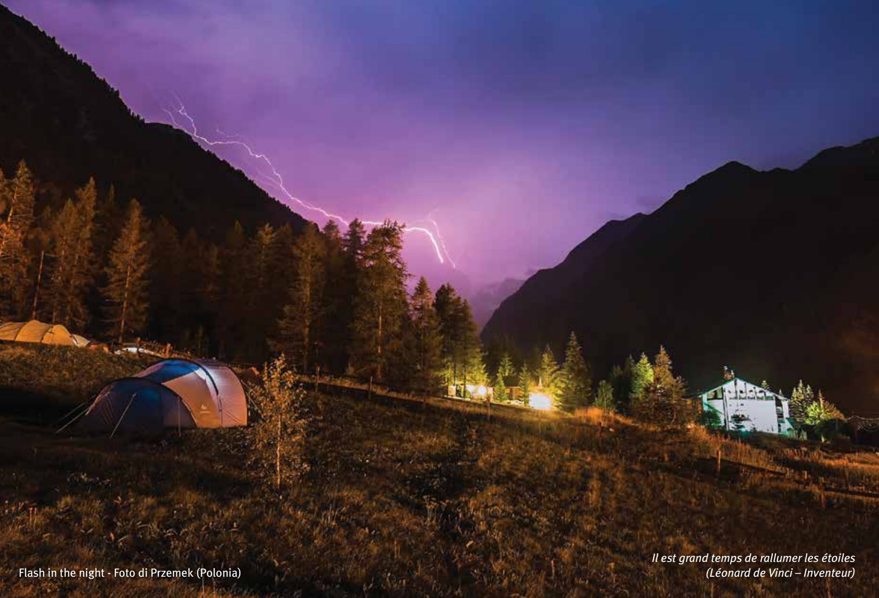
Flash in the night

Il est grand temps de rallumer les étoiles (Léonard de Vinci – Inventeur)