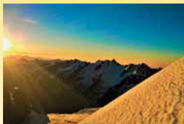
Dal Piccolo Paradiso verso gli Apostoli

Foto di Jacopo Glarey (Cogne - Valle d'Aosta)