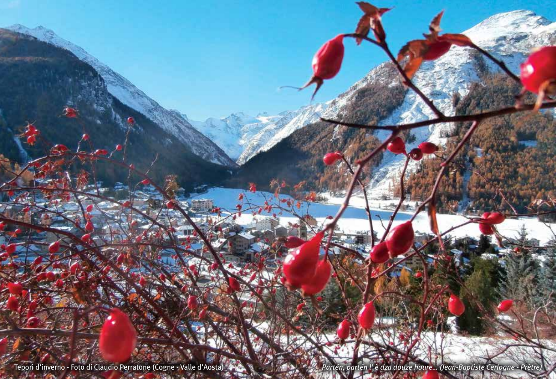
Tepori d'inverno (Cogne - Valle d'Aosta)