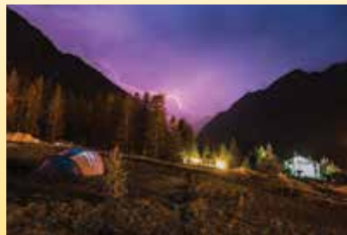
Flash in the night